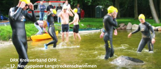
DRK Kreisverband OPR – 12. Neuruppiner Langstreckenschwimmen