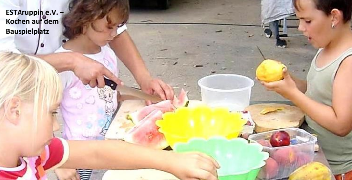
ESTAruppin e.V. – Kochen auf dem Bauspielplatz

Nur gemeinsam können wir etwas erreichen!