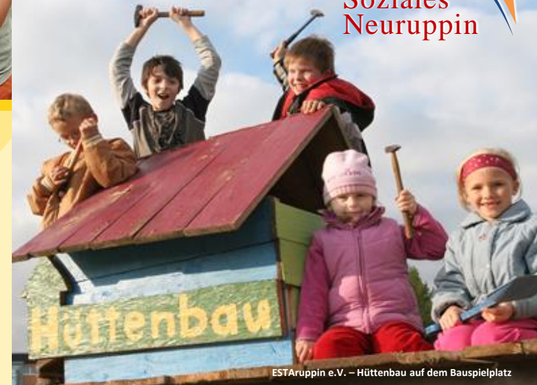
ESTAruppin e.V. – Hüttenbau auf dem Bauspielplatz