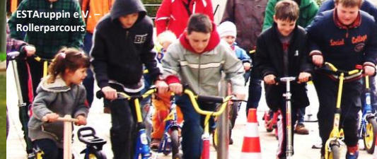
ESTAruppin e.V. – Rollerparcours