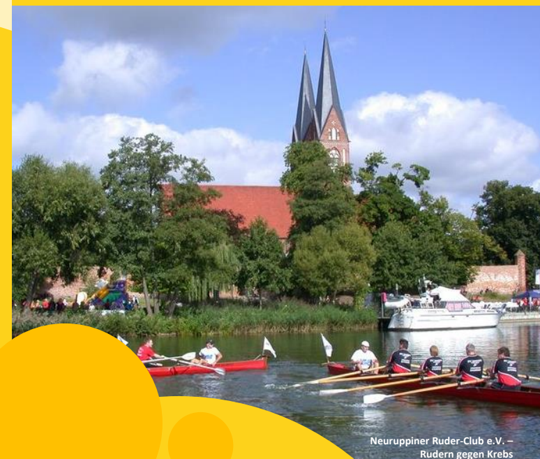
Neuruppiner Ruder-Club e.V. – Rudern gegen Krebs