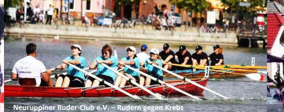
Neuruppiner Ruder-Club e.V. – Rudern gegen Krebs